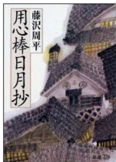
『用心棒日月抄』 藤沢周平／著 新潮社 ¥740（税込）

これさえあれば、心安らくなれる不思議な本、それが藤沢周平の用心棒シリーズです。本書のほかに『孤剣』『刺客』『凶刀』の四部作は、常にベッドの脇に置いてあり、仕事で気になることがあったり、眠れない時、手にとって読み始めます。