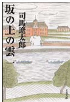
『坂の上の雲』(全8巻) 司馬遼太郎／著 文藝春秋 ¥620（税込）・各巻とも

学生の頃、和洋問わず歴史ものに凝っていた時期がありました。私が好きな司馬作品の中でも特に印象深かったのが本書です。物語の舞台は明治維新後、近代化に邁進する弱小国日本。植民地政策を推し進める列強に併呑されかねない中で、二人の若い兄弟を中心に個性豊かな登場人物が知恵と勇気の限りを尽くして、日露戦争を勝利に導く姿が非常に興味深く描かれています。